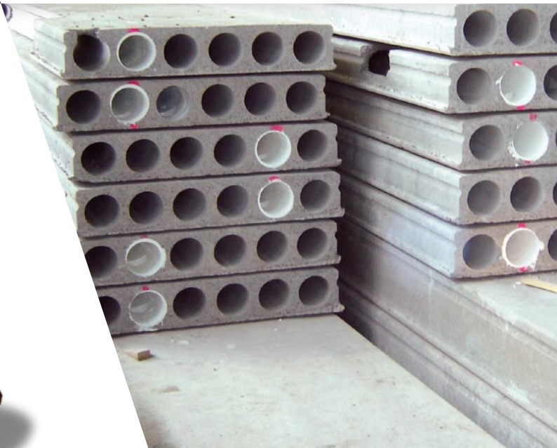
Plattenstapel mit beschichteten Hohlkammern.