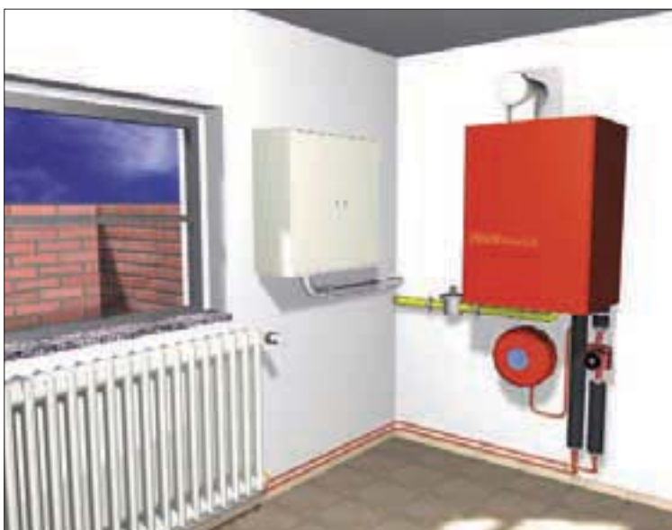
Wandhängende „SteamCell“ (r.) neben dem Elektro-Hausanschlußkasten: heute noch Animation, im Jahr 2005 Realität?

Enginion AG Gustav-Meyer-Allee 25 13355 Berlin Telefon (0 30) 46 30 74 92 Telefax (0 30) 46 30 74 99 www.enginion.com