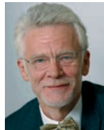
Prof. Dr. E. Jürgen Zöllner Senator für Bildung, Wissenschaft und Forschung, Berlin