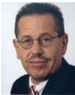
Rudolf Anzinger Staatssekretär im Bundesministerium für Arbeit und Soziales

- Wirtschaftsministerkonferenz der Länder (WiMiKo):