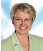
Dr. Annette Schavan, MdB, Bundesministerin für Bildung und Forschung