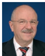
Manfred Kremer Präsident des Bundes- instituts für Berufs- bildung (BIBB)