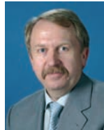
Helmut Rau Minister für Kultus, Jugend und Sport; Baden-Württemberg

- Ständige Konferenz der Kultusminister der Länder in der Bundesrepublik Deutschland (KMK):