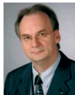
Dr. Reiner Haseloff Minister für Wirtschaft und Arbeit des Landes Sachsen-Anhalt