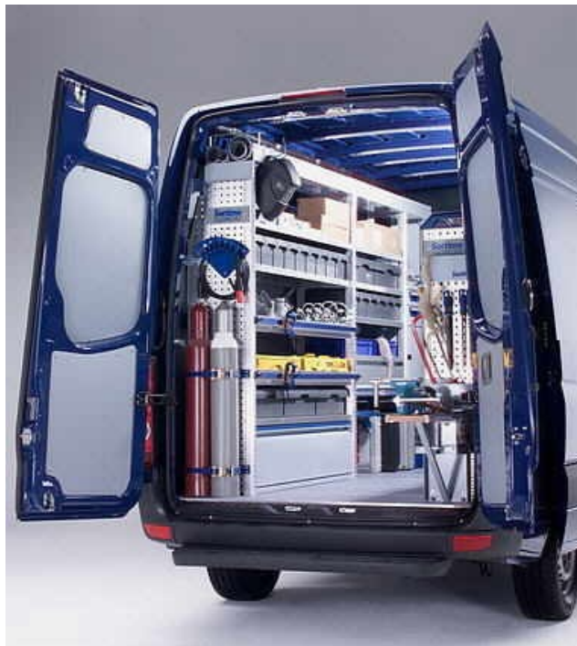
Fa. Sortimo International GmbH